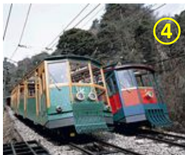
六甲ケーブル下駅