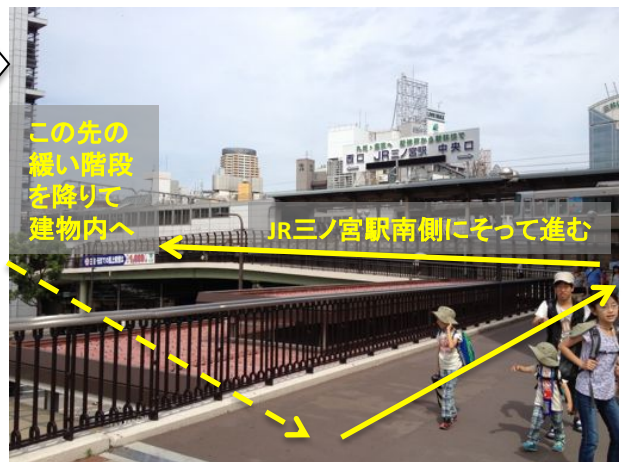
この先の 緩い階段 を降りて 建物内へ JR三ノ宮駅南側にそって進む