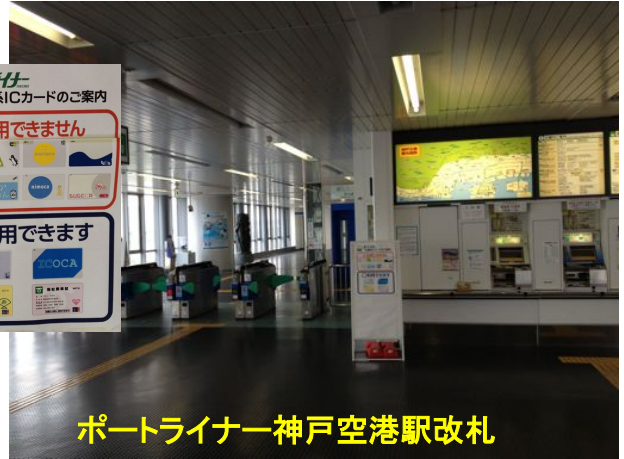
ポートライナー神戸空港駅改札