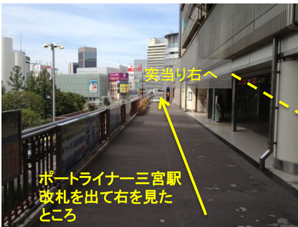
ポートライナー三宮駅 改札を出て右を見た ところ