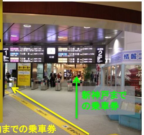
神戸市内までの乗車券